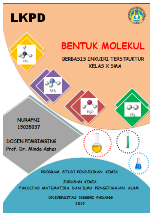
Gambar 1. Cover

Tujuan tahap design adalah untuk mendesain LKPD bentuk molekul berbasis inkuiri terstruktur yang dikembangkan. Tahap perancangan ini sesuai dengan hasil angket peserta didik SMAN 1 Pariaman yang mana peserta didik menginginkan LKPD yang mudah dipahami, memiliki gambar dan warna yang menarik serta dilengkapi dengan pemodelan. LKPD bentuk molekul disusun berdasarkan beberapa komponen sebagai berikut: 1) cover; 2) kata pengantar; 3) daftar isi; 4) daftar gambar; 5) petunjuk penggunaan LKPD; 6) kompetensi inti; 7) kompetensi dasar; 8) indikator pencapaian kompetensi; 9) tujuan pembelajaran; 10) peta konsep; 11) pendahuluan; 12) lembar kegiatan; 13) lembar kerja; 14) evaluasi. Cover dan lembar kegiatan dapat dilihat pada Gambar 1 dan Gambar 2.