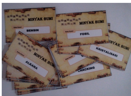
Gambar 4. Desain Kartu Soal

Permainan ini mengharuskan pemain dapat menjawab soal-soal yang diberikan oleh koordinator permainan. Setiap pemain yang sudah menyusun satu kata yang ada dalam daftar kata kunci harus menjawab soal yang diberikan koordinator sesuai kata kunci yang tela disusunnya. Soal-soal ini diberikan oleh koordinator permainan kepada pemain dalam bentuk kartu soal. Kartu soal disusun sesuai dengan tuntutan Indikator Pencapaian Kompetensi (IPK) pada materi Minyak Bumi. Desain kartu soal dapat dilihat pada Gambar 4.