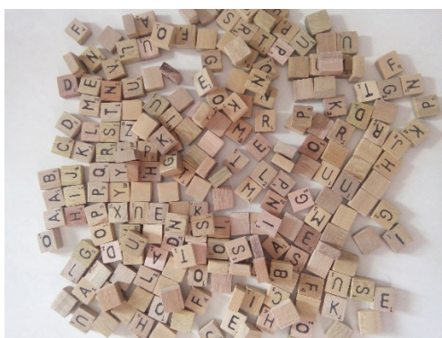
Gambar 2. Kepingan Huruf