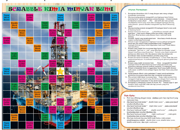
Gambar 1. Papan Scrabble Kimia

Papan Scrabble Kimia didesain sesuai dengan materi minyak bumi dengan diberi gambar yang berkaitan dengan minyak bumi. Papan Scrabble Kimia dapat dilihat pada Gambar 1.