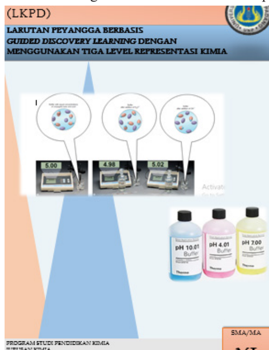
Gambar 1. Kover LKPD

learning dengan menggunakan tiga level representasi kimia yang telah disusun berdasarkan komponen LKPD yang terdiri dari; 1) Kover, 2) kompetensi yang akan dicapai, 3) petunjuk penggunaan LKPD, 4) peta konsep, 5) lembar kegiatan siswa, 6) lembar kerja, 7) kunci lembar kerja, 8) lembar evaluasi, 9) kunci evaluasi. Kover LKPD dan lembar kegiatan berturut-turut diamati pada Gambar 1 dan Gambar 2.